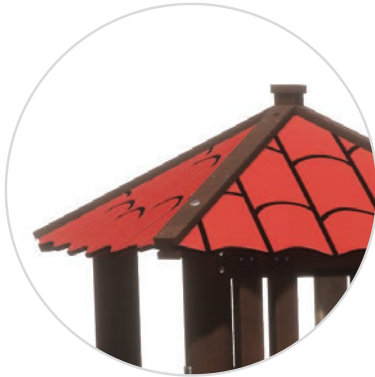
Schilddak met monniksdakpannen

Rode monniksdakpannen doen denken aan de warmte van de Middellandse Zee. Leigrijze metalen daken weerspiegelen de pracht en praal van 18e-eeuwse kerken, kastelen en kathedralen.